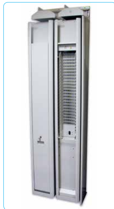
Две стойки СОКР- 2,2М в ряду