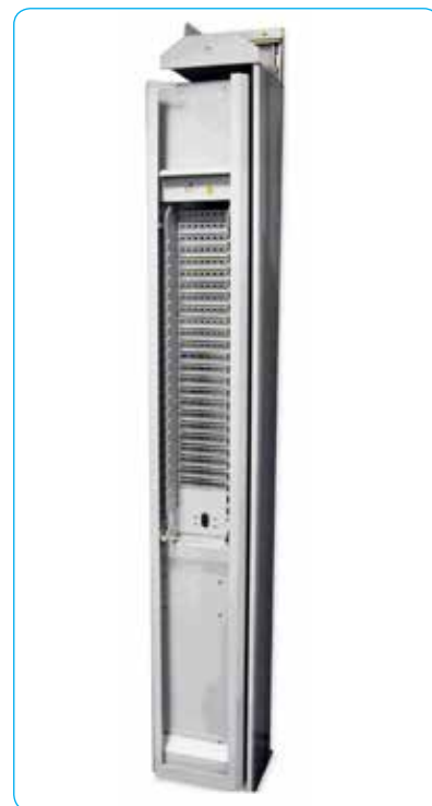
Стойка СОКР- 2,2М