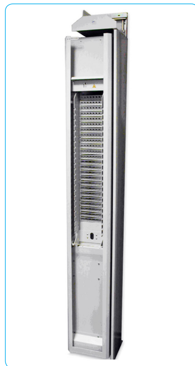
Стойка СОКР- 2,2М