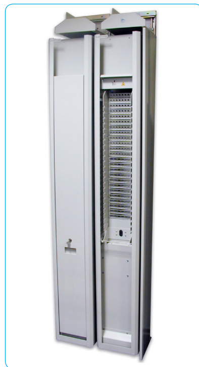
Две стойки СОКР- 2,2М в ряду