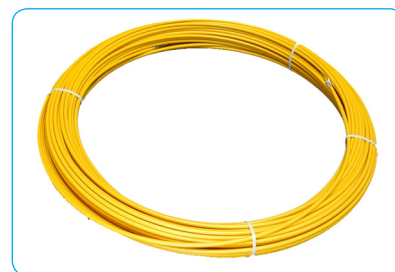
Стеклопруток для УЗК-11