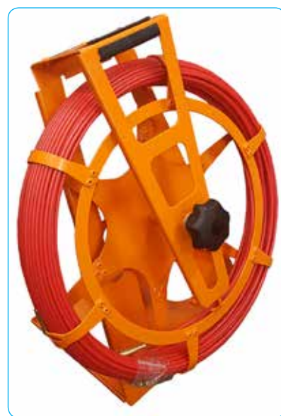
Устройство УЗК-Р 4Л/60